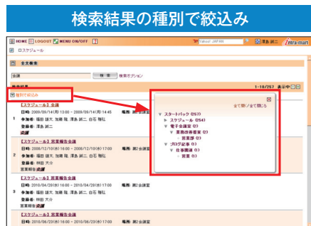
検索された結果一覧を、更にintra-mart上の各種アプリケーションや開発したアプリケーション単位に選択し絞り込む事ができます。

複数の業務システムにまたがる情報をドリルダウン(アプリケーション別やカテゴリ別に検索結果をさらに絞り込む)により、スムーズな情報検索が可能になります。