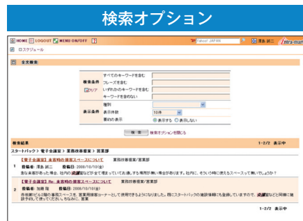
全文検索の検索時に検索条件を詳細に指定が可能です。また検索された結果に対して要約の表示をするなど各種条件の指定が可能です。